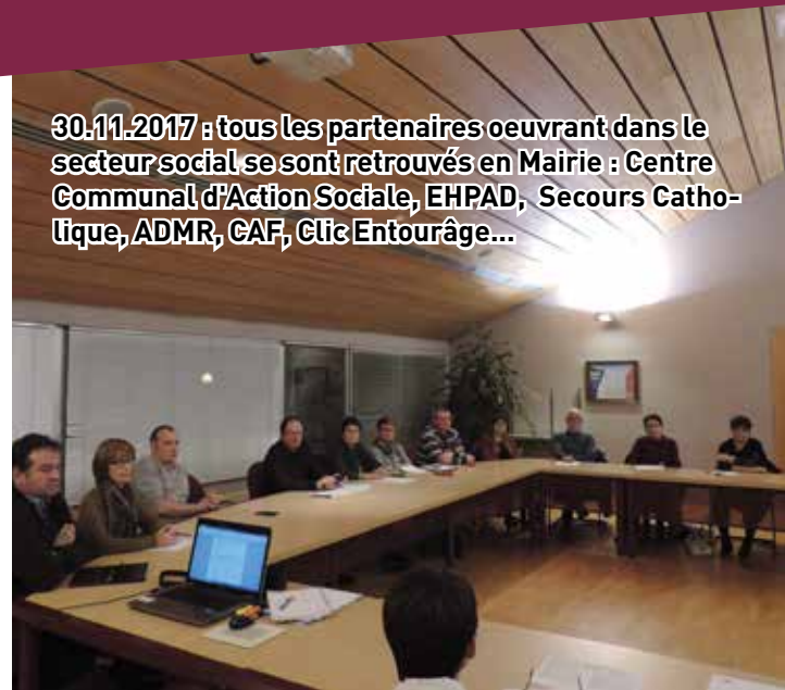
30.11.2017 : tous les partenaires oeuvrant dans le secteur social se sont retrouvés en Mairie : Centre Communal d'Action Sociale, EHPAD, Secours Catholique, ADMR, CAF, Clic Entourage...