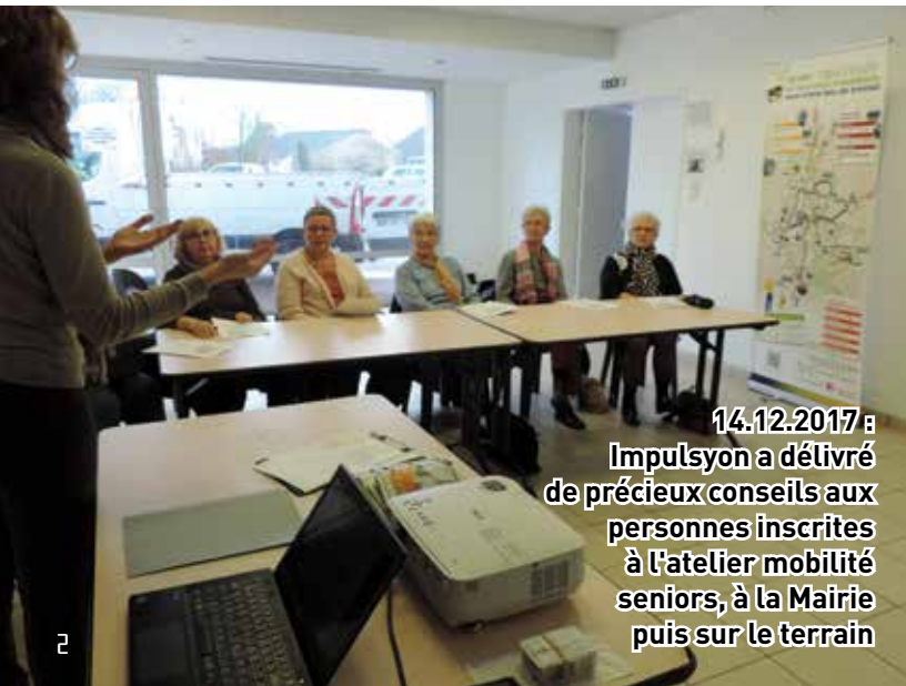
14.12.2017 : Impulsyon a délivré de précieux conseils aux personnes inscrites à l'atelier mobilité seniors, à la Mairie puis sur le terrain