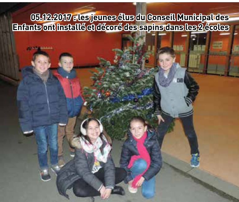
05.12.2017 : les jeunes élus du Conseil Municipal des Enfants ont installé et décoré des sapins dans les 2 écoles