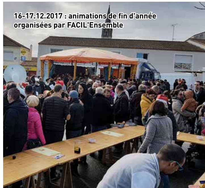
16-17.12.2017 : animations de fin d'année organisées par FACIL'Ensemble