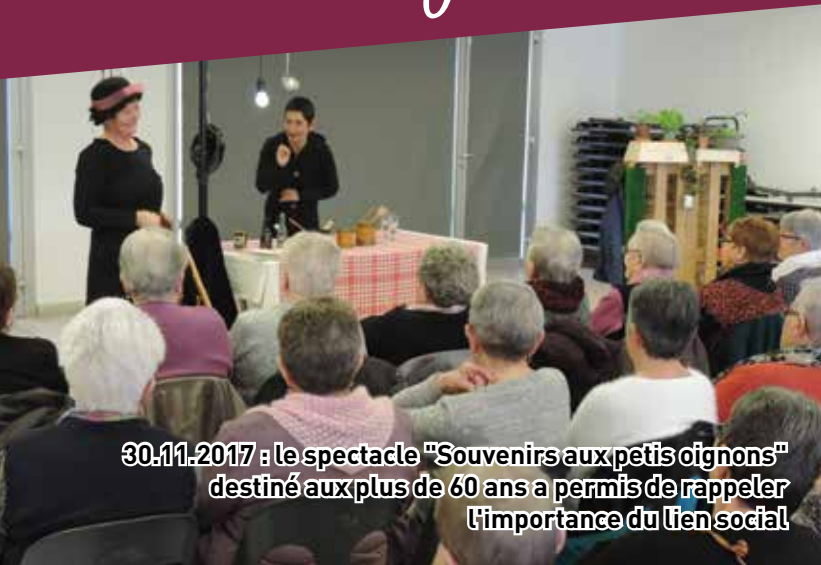
30.11.2017 : le spectacle "Souvenirs aux petits oignons" destiné aux plus de 60 ans a permis de rappeler l'importance du lien social