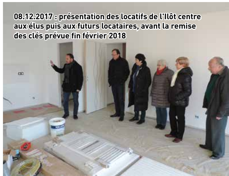
08.12.2017 : présentation des locatifs de l'îlot centre aux élus puis aux futurs locataires, avant la remise des clés prévue fin février 2018