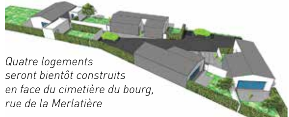
Quatre logements seront bientôt construits en face du cimetière du bourg, rue de la Merlatière