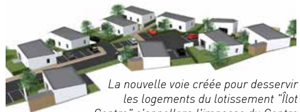
La nouvelle voie créée pour desservir les logements du lotissement "Îlot Centre" s'appellera l'impasse du Centre (décision du Conseil Municipal du 8 février 2017)

Dans les quartiers, on comptera bientôt 15 logements sociaux supplémentaires : 3 dans l'extension du Lotissement "Les Petites Noues" et 12 au sein du Lotissement "Le Caillou Blanc 2" (2 sur la tranche 1 et 10 sur la tranche 2).